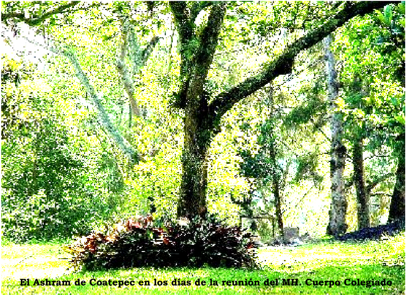
El Ashram de Coatepec en los días de la reunión del MH. Cuerpo Colegiado