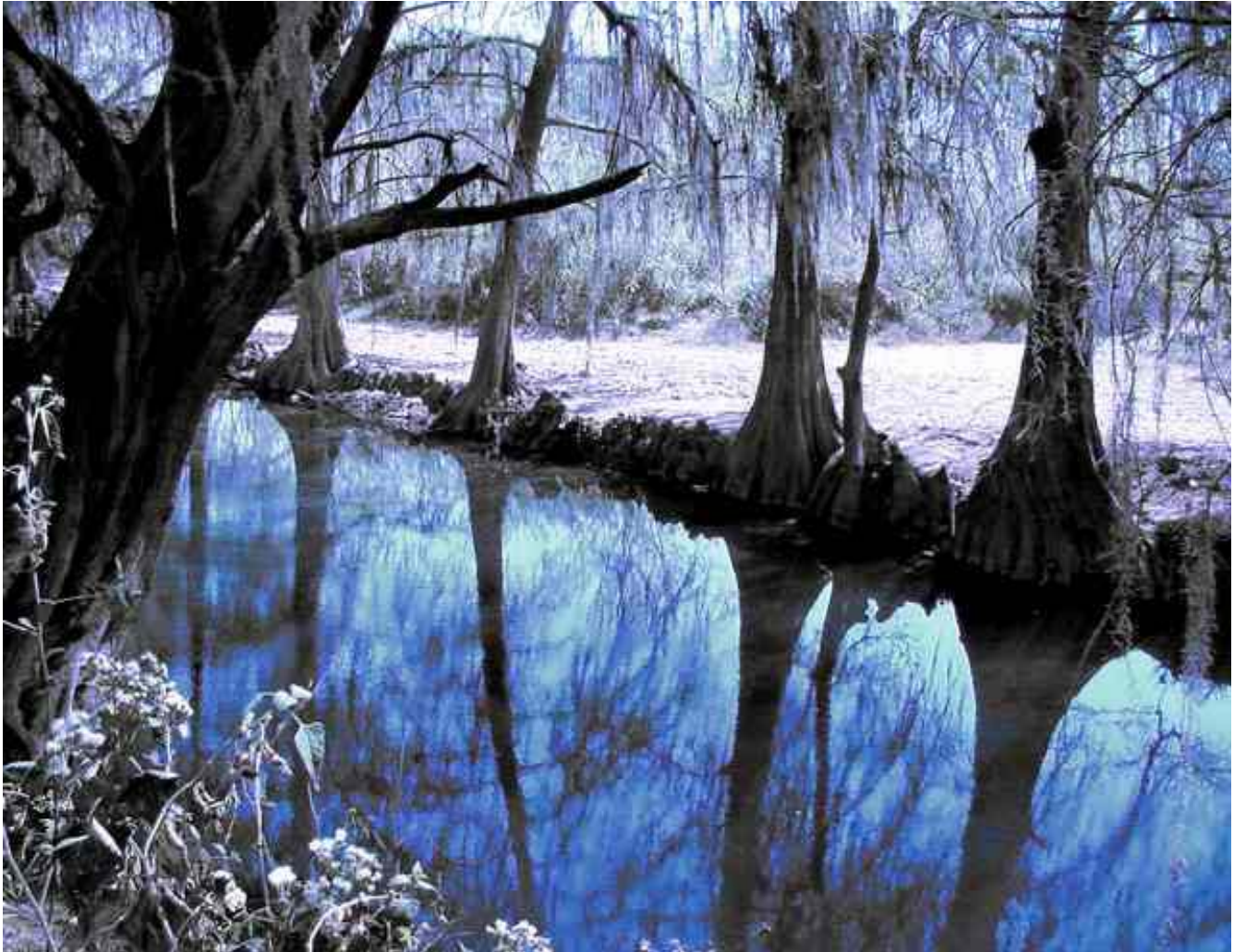
REMANSO DEL RÍO RAMOS A ORILLAS DEL ASHRAM DE LA RedGFU EN RAÍCES, NUEVO LEÓN, MÉXICO

ésta: para vivir sano y gozar la vida todo el tiempo que nos de la vida hay que evitar la embriaguez y la enviaguez (*).