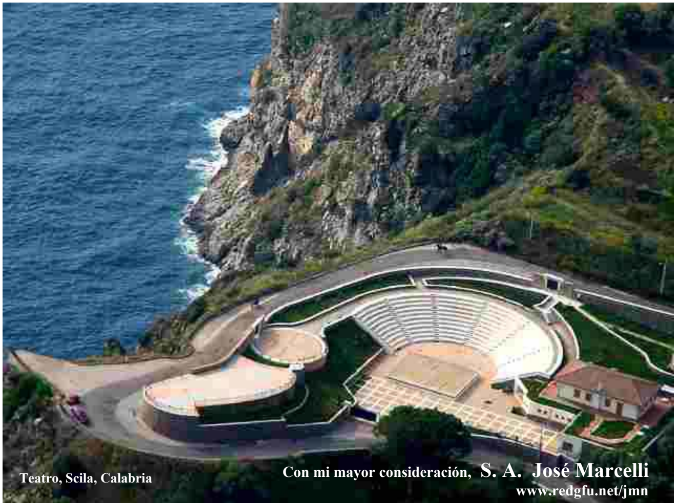
Teatro, Scila, Calabria

Iniciación Real, y el conjunto de obras que realizan entre todos, son solamente aportaciones a la Magna Obra de la Verdad que se refleja en la Realidad para adquirir conciencia de ella misma, así como el Ser se refleja en lo Humano para conocerse a sí mismo siguiendo un camino interior que se refleja en su medio ambiente exterior. A esto se puede agregar que la dualidad de la Realidad, en el caso de los Seres Humanos, es masculina y femenina y la afirmación de una polaridad se refleja en la complementaria, y las dos, equilibradas, con todo su potencial, reafirman el potencial puro del Ser desde los planos instintivos hasta los trascendentales.