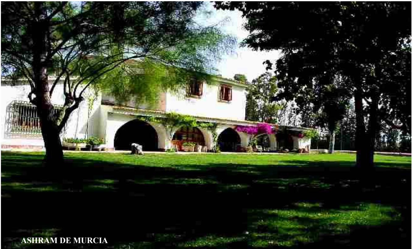
ASHRAM DE MURCIA