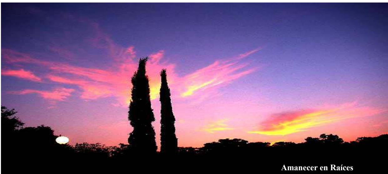
Amanecer en Raíces

D urante muchos años trabajé como constructor y decorador profesional. Entre otras cosas mi trabajo consistía en hacer todo con - buen gusto , - sin contradecir el gusto de mis clientes,- y tuve oportunidad de conocer muchos gustos buenos y malos, tanto Orientales como Occidentales, y sus consecuencias en el Arte, la Religión y el Amor. Por ejemplo, el Feng Shui , que ahora esta de moda, tiene aciertos de muy buen gusto y también supersticiones que no pasan de ser consejas de brujos. Con el Tao del Amor pasa lo mismo.