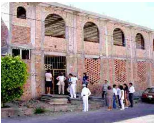
Casa Sede, (en construcción) Tepic, Nayarit, Méx.

S omos Iniciados y seguimos avanzando. Mientras falte algo por hacer no se ha hecho nada , como decía Don Simón Bolívar, - dije a los Hermanos de Tepic, en Nayarit, que siguen trabajando para construir su Casa Sede y ponerla al servicio de la comunidad Nayarita, en el Noroccidente de México - El presente es la eternidad, el pasado ya no existe, es solamente un punto de referencia para entender el presente que se gestó en el pasado; el futuro todavía no existe y debemos crearlo a partir del presente. El presente es el instante que estamos viviendo como resultado de los instantes pasados y es el peldaño para vivir los instantes futuros. La Realidad es infinita hacia lo grande y hacia lo pequeño, pero nuestra conciencia todavía es muy limitada y sólo percibe instantes en la eternidad. Necesitamos hacerla crecer reflejándola en hechos de servicio a la vida que se retornen como efectos en nuestra propia vida. La vida mantiene su unidad dentro de su diversidad y cada causa retorna como efecto. El destino lo hacemos nosotros, consciente o inconscientemente. No hay nadie a quien culpar. La conciencia de un Ser