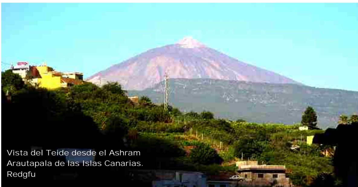
Vista del Teide desde el Ashram Arautapala de las Islas Canarias. Redgfu